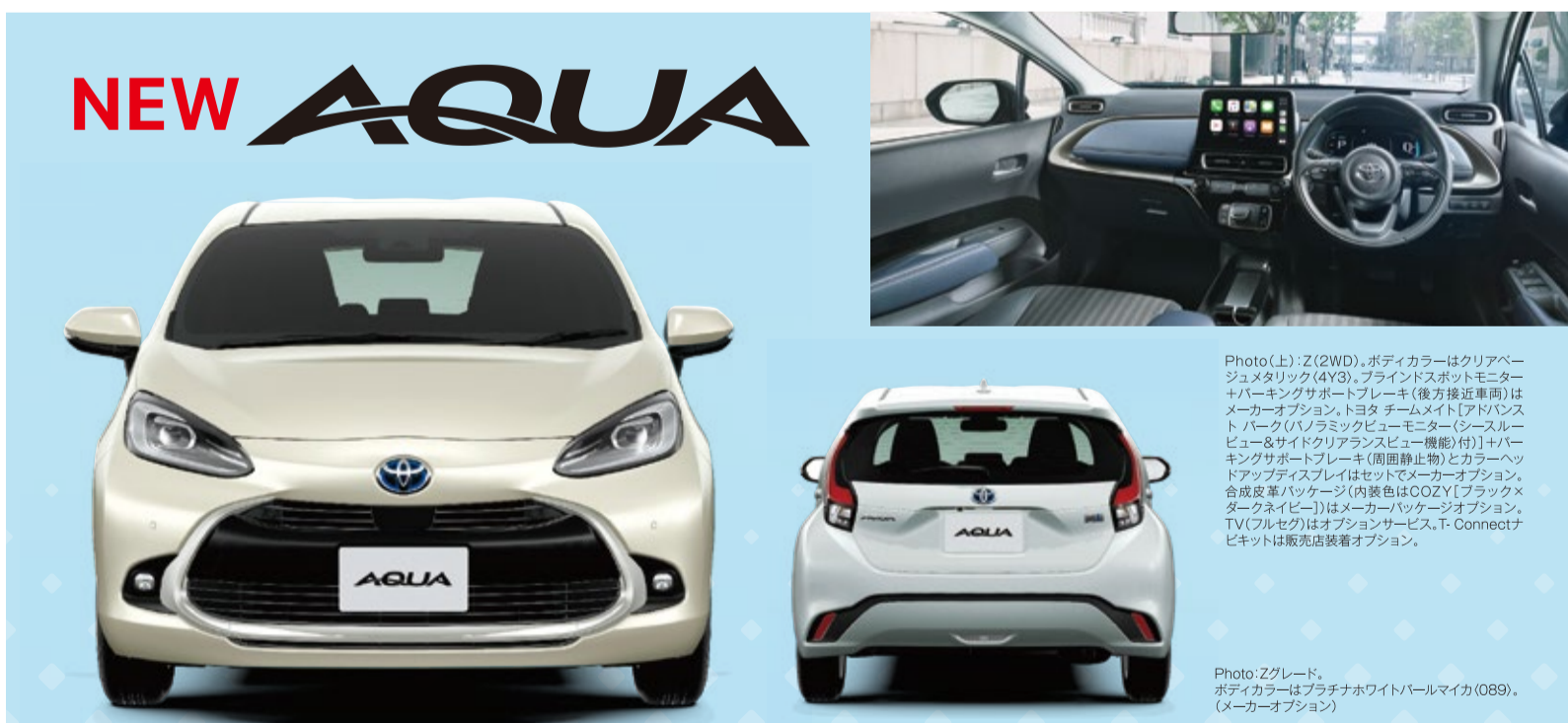
Photo: (上) Z(2WD), ボディカラーはクリアベージュメタリック(4Y3), ブラインドスポットモニター+パーキングサポートブレーキ(後方接近車用)はメーカーオプション、トヨタ チームメイト [アドバンスト パーク(パノラミックビューモニター(シーズルービュー)とサイドリアランスビュー機能)付]]+パーキングサポートブレーキ(両側静止物)とカラーヘッドアップディスプレイはセットでメーカーオプション、合成皮革パッケージ(内装色はOOZY(ブラックメダークネイビー))はメーカーパッケージオプション、TV(フルセグ)はオプションサービス、T-Connectナビは販売店装着オプション。