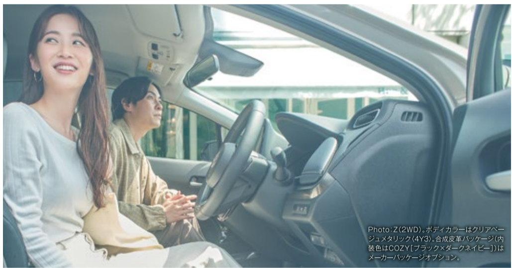
Photo: Z(2WD), ボディカラーはクリアベージュメタリック(4Y3), 合成皮革パッケージ(内装色はOOZY(ブラックメダークネイビー))はメーカーパッケージオプション。