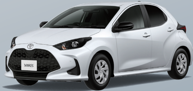
Uグレード HEV 1.5L