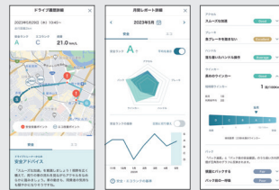
アプリ画面(イメージ)

運転データをいつでもどこでもスマホでチェック。さらにデータをもとにご自身に最適な装備をご提案。