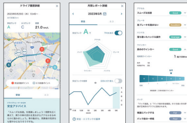
アプリ画面(イメージ)

運転データをいつでもどこでもスマホでチェック。さらにデータをもとにご自身に最適な装備をご提案。