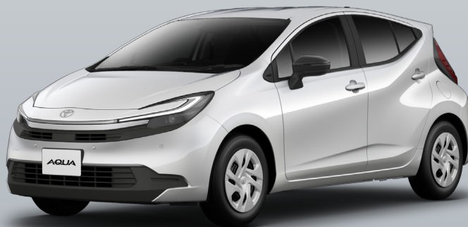
Uグレード HEV 1.5L

*1 Uグレード(2WD)・最安値パッケージ・追加オプションなし。初期費用フリープラン7年契約、ボーナス月加算16.5万円の場合